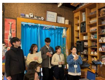
学部生・大学院生による発表

本学多職種連携教育研究研修センター主催による、さらなる発展を遂げた「第2回 Global Student IPE Leader Camp」が、韓国・済州島で開催されました。4か国6大学から学生27名、オンラインで2校、教員12名が参加し、多職種連携教育（IPE）の役割や課題について理解を深めました